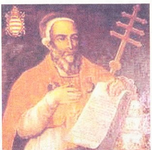
Papa Klement V.