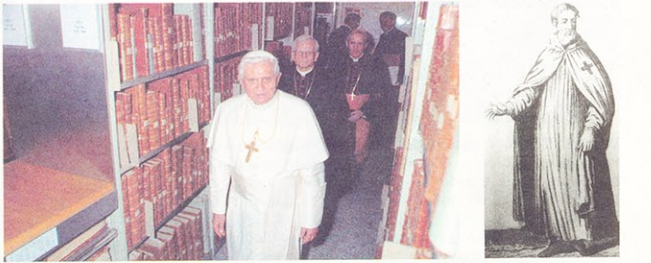
Benedikt XVI. u vatikanskim tajnim arhivima

»Da Vincijev kod« te najrazličitijim tekstovima o zlatnom gralu i zavjetnom kovčegu, čiji su čuvari bili, dakako, nesretni templari. Iz njih se izvlači i geneza bizarnog Siomskog priorata, navodnog čuvara »prave istine« o Isusu Kristu i njegovim potomcima, nastanak iluminata i slobodnih zidara (masona) i još niz fantastičnih priča o rodoslovljima koja bi trebala sezati do našeg vremena.