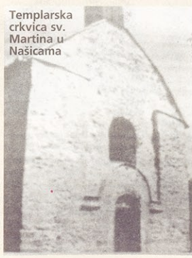
Templarska crkva sv. Martina u Našicama