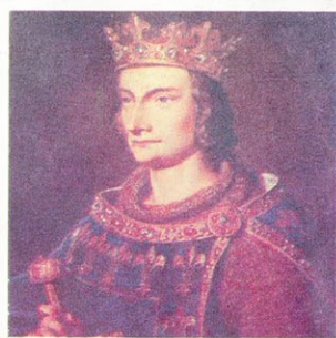
Francuski kralj Filip IV.

U krvi i vatri ukinuta družba »Siromašnih vitezova Kristovih« doživjela je satisfakciju nakon sedam stoljeća, a tek sada je otkriveno da je optužba za herezu zapravo bila »dimna zavjesa« kako bi se francuski kralj Filip IV. Lijepi domogao njihovih golemih bogatstava