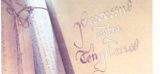
Replika dokumenta pape Klementa V. o templarima iz 1301. koji je otkriven 2001. a objavljen 9. listopada u Vatikanu