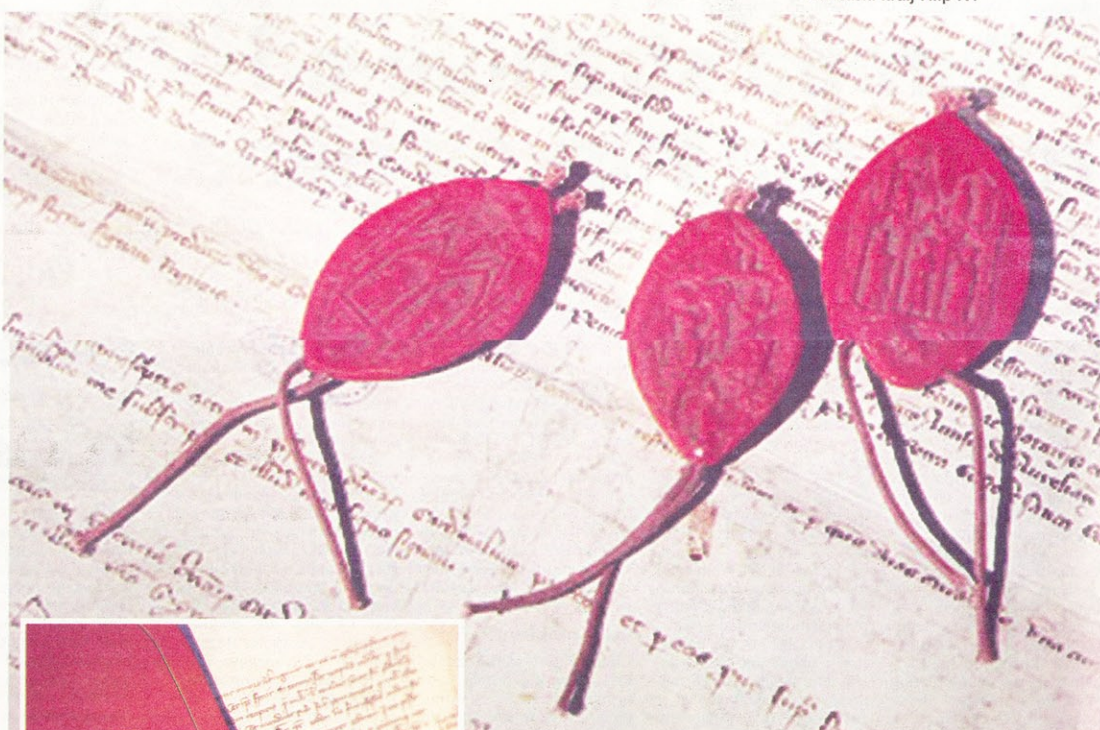
Replike tri pečata koje su inkvizitori koristili pri istragama prije 700 godina, na dokumentu kojim je papa Klement V. oslobodio templare optužbi za herezu

jama. U petak 13. listopada (tu je i ishođište fame o petku 13!) svi su francuski templari bačeni u tamnice, da bi ih zatim inkvizitori podvrgli najtežim torturama i na stotine njih spaljeno je na lomacima, dok je samo manji dio pobjegao u rubne europske zemlje. Iako je i onda bilo jasno da papa nije bio uvjeren u njihovu krivnju, 1312. je zbog izravnih prijetnji francuskog kralja na koncilu bio