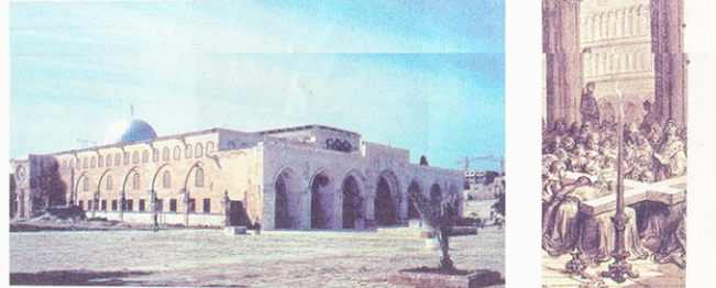
Solomonov hram u Jeruzalemu